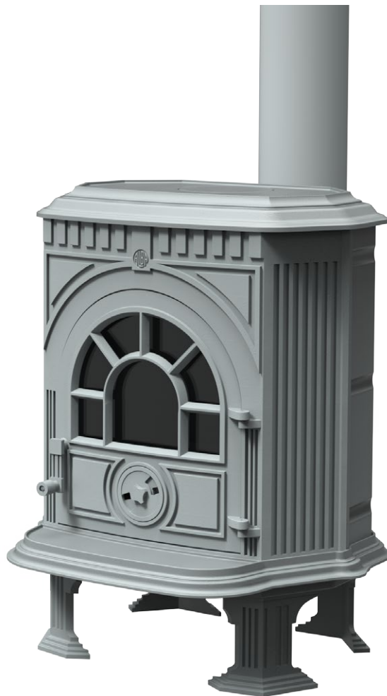
Alba Stove Alba Salamandra design Pedro Martins Pereira